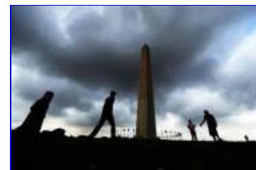
Turistas visitando el Monumento a Washington de la capital estadounidense.